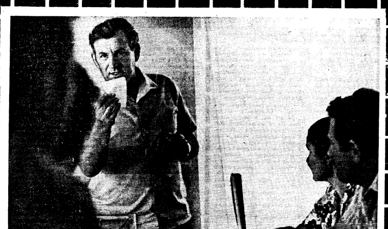
Общественный отдел кадров: «Убедительны ли мотивы увольнения?»