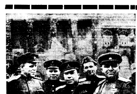
В центре — май 1945 г. У памятника солдатам. Справа — май 1945 г. У памятника солдатам. Справа — май 1945 г. У памятника солдатам.

Центр СОЛДАТ НА ШТУРМ РЕЙХСТАГА Виктор Розов. Пьеса. Впервые опубликовано в журнале «Искусство».