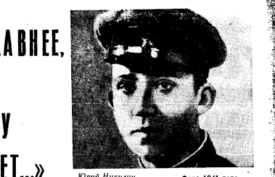
Юрий Никулин Фото 1941 года