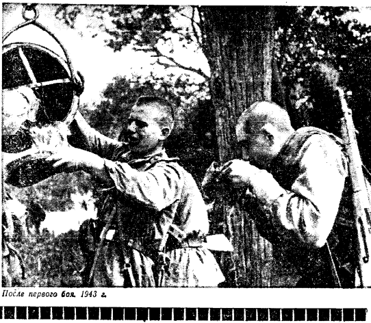
После первого боя, 1943 г.