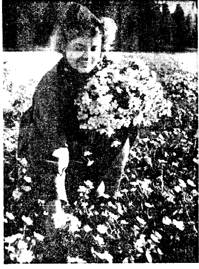
Миковича тишины, 1942 г.