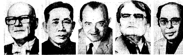
Урхо Калева Кекконен, Ле Зуан, Мигель Отеро-Сальва, Эрве Базен, Абдурахман аль-Хамиси

Председатель комитета Н. Н. БЛОХИН (СССР); члены комитета: Г. В. АЛЕКСАНДРОВ (СССР), ЛУК АРАГОН (Франция), МИРЯМ ВИРЕ-ТУОМИНЕН (Финляндия), РЕНАТО ГИТТУЗО (Италия), АННА ЗЕБЕРС (ГДР), КЕШВ ДЕВА МАЛАБИЯ (Индия), СОЛО МАРИНЕЛЬО (Куба), ДЖИМС ОЛДРИДЖ (Великобритания), ИГНЕН ТХИ БИНЬ (СРВ), Н. В. ТОМСКИЙ (СССР), ЮЗЕФ ЦИРАНКЕВИЧ (ПНР), А. Б. ЧАКОВСКИЙ (СССР).