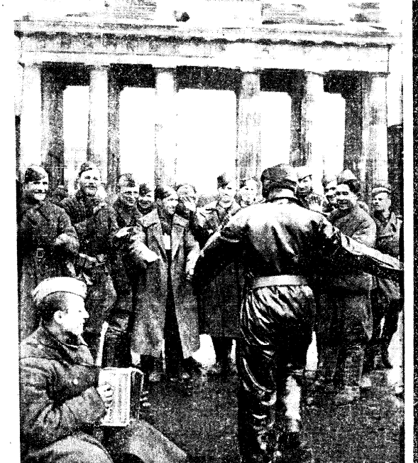
Берлин, 9 мая 1945 года.

Стремись к тому, чтобы отдать все свои силы делу партии, делу народа, советские писатели активно участвуют в борьбе за мир — и творчеством, и общественной деятельностью, считая эту борьбу своей первой обязанностью, своим священным долгом.