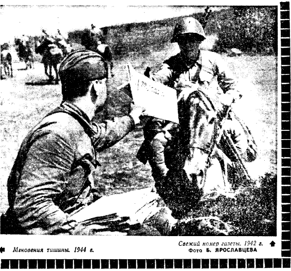
Свежий юмор газеты, 1942 г.

Говорят лауреаты международной Ленинской премии